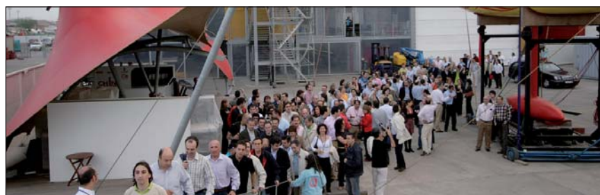
Paseo en barco

Los actos programados para este día culminaron con una cena de gala emplazada en el Hotel Las Arenas Balneario Resort, donde también se hizo entrega de una serie de premios y distinciones a los coordinadores de los Grupos de Trabajo y delegados.