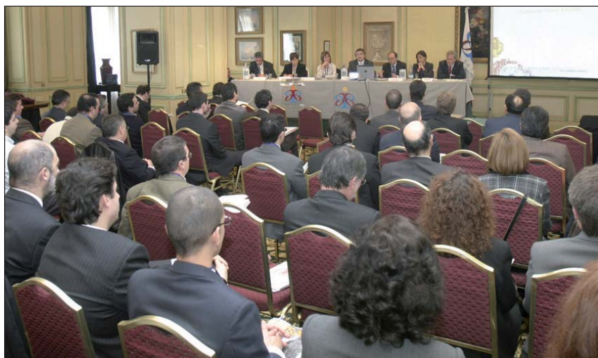
Junta Directiva de AUSAPE.

Después de la presentación y aprobación del presupuesto se produjo la renovación de algunos cargos dentro de la Junta Directiva a raíz de las tres dimisiones presentadas. Los tres nuevos integrantes que fueron elegidos para formar parte de esta Junta Directiva de AUSAPE son: