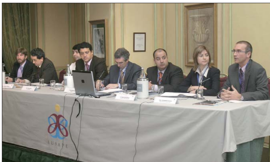
Coordinadores de Grupos de Trabajo AUSAPE.

La XIII Asamblea General de AUSAPE se celebró el día 30 de enero de 2007 en el Hotel Westing Palace de Madrid. En esta edición se mostró a los asociados todas aquellas acciones que se han llevado a cabo conforme al plan de actuación 2006-2007, que se puso en marcha el pasado año. En este plan se marcaron una serie de pautas para conseguir, como objetivos, el fortalecimiento y expansión de AUSAPE, así como la mejora y ampliación de los productos y servicios que se ofrecen.