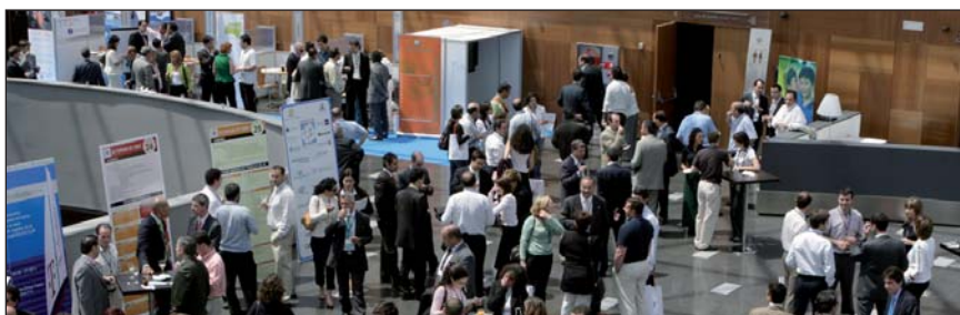
III Edición del Forum GT.