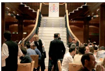
Cena de gala en el Hotel Las Arenas Balneario Resort.